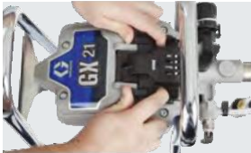
1 Abra la tapa de acceso