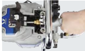
2 Saque la bomba