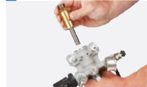
4 Coloque un nuevo kit de empaquetaduras