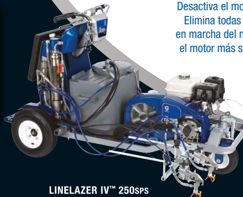
LINELAZER IV™ 250SPS