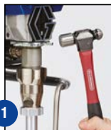
1 Afloje la tuerca de fijación

¡Se acabó perder tiempo y dinero en mano de obra para la reparación de bombas!